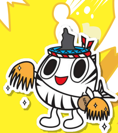
「さつま黒潮きばらん海 枕崎港まつり」 マスコットキャラクター「キバッチョ」