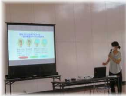
【学校薬剤師による講話】