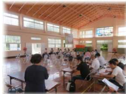
【健康診断の結果報告】

養護教諭・保健体育科教諭から保健・体育面に関する報告を行ったあと、学校薬剤師の先生を講師として「薬物乱用防止について」の講話を実施しました。