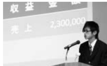
▲家庭と社会の会計管理の違いから、簿記について調査・研究した内容を発表