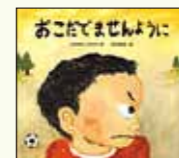
おこだでませんように ぐすきしげの(作)石井聖岳(絵)