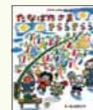
たなばたさまきらきらら 長野ヒデ子(作・絵)