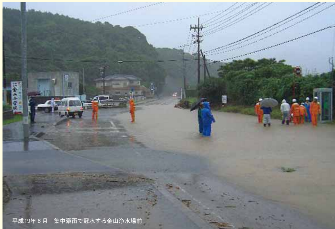
平成19年6月 集中豪雨で冠水する金山浄水場前

「災害は忘れた頃にやってくる」と言われるように、災害は突然やってきます。市民一人ひとりが災害への意識を高め、「もしも」の時に備えなければなりません。