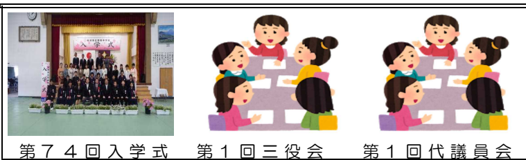
第74回入学式 第1回三役会 第1回代議員会