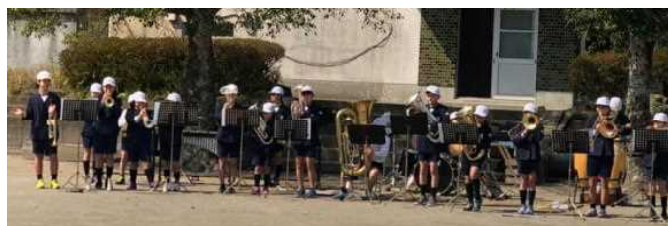
【金管バンドの演奏会もできてよかった！】