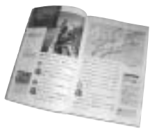
近海・遠洋カツオ漁などを紹介

まず水産センター2階の会議室で漁協職員によりカツオ漁業の概要の説明が行われ、ビデオ鑑賞を交え洋上での一本釣りや水揚げの様子などを学習しました。その後、児童たちは水揚げ場や製氷工場を見学。普段入ることのない製氷工場では、「寒い寒い」と言いがらも楽しそうに見学していました。 施設見学が終わると、水産センターに戻り質問の時間。「冷凍したカツオはなぜ口が開いているの?」などといった児童たちの質問に、漁協の職員が丁寧に答えました。 最後にお待ちかねの昼食では「枕崎ぶえん鰹」の刺し身や腹皮の唐揚げが出され、どの学校の児童たちもおいしそうに残さず食べていました。