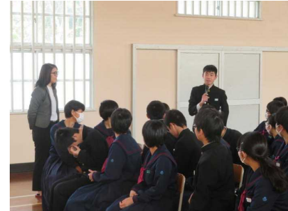
(左) ブラジルでの生活や日本語学校の紹介 (右) 「自分だったらどうするか」考えたことを発表