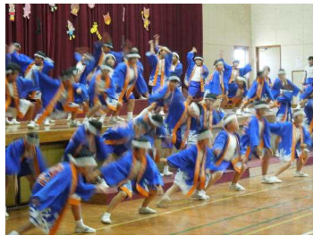
5年「心躍るソーラン節」