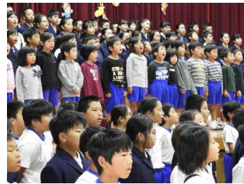
全体合唱「チャレンジ」

1年生から6年生までの子どもたちが、日頃学習してきた成果を発表しました。どの学年もこれまでの練習の成果を十分に発揮し、心に残る学習発表会になりました。