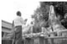
▲9月23日に行われた招魂塚慰霊祭の様子

先 月の、戌辰の日は勝ち鹿であったが、西南の役は鹿籠籠町にまつまに涙橋であった。鹿籠籠町市元には涙橋電停があるが、ここは南方郷から出征した内の90名が、海路鹿籠籠を占拠した官軍との激戦にわずか十数時間で戦死した決戦の地である。「涙橋血戦の碑」が建てられており、その碑文は南方神社下の招魂塚碑文の内容にほぼ等しい。西南の役で今の枕崎市の近郊から405人が従軍し、125人が戦病死した。南薩の各郷に比較してその数が非常に多いのは先月編った末野元意（今給黎、児玉久清）どんの募兵によるものであろうと、市誌にある。血気盛んな気風をうかがい知るべし、昔は家の神棚の脇に戦後官軍が出した逮捕令状などを掲げ、服役した薩摩の父兄の男を讃えたものであると伝え聞いた。 愉快である。先月23日、例年に則り招魂塚慰霊祭が肅々と催された。先の大戦の戦没者や被災者を慰霊することや海上特攻第一艦隊戦没者追悼式と同様、枕崎市の貴重な催しであらう。さりながら西郷参議が、「死んでんよか、朝鮮国と話し合いをして行く」として上奏し御裁可を得たものを反故にした外遊組の判断が発端となった西南の役、大南洲の意を汲まなかつたお歴々に今の政府内閣の骨柄を願う。