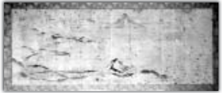
＝第四回＝ まくらざきふうけいが 市指定文化財 枕崎風景画