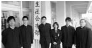
平成22年度生徒会執行部

平成21年10月20日、生徒会役員選挙が行われ、平成21年度生徒会から平成22年度生徒会へ「生徒会活動へのやる気と意志」が受け継がれました。そこで今回は、鹿水高の生徒たちを引っ張って、水高を盛り上げる生徒会執行部を紹介します。