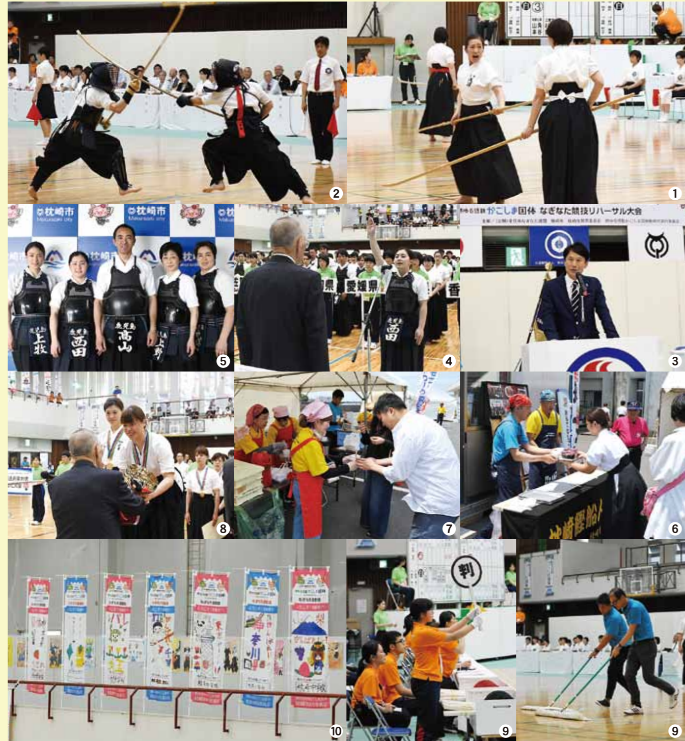
①演技競技のようす ②試合競技のようす ③開会式に出席した三反園訓県知事 ④選手宣誓は鹿児島県代表の西田智香選手 ⑤試合競技で8位入賞した鹿児島県代表選手団 ⑥市通り会連合会による枕崎鯉船人めしの振る舞い ⑦まくらざきハーモニーネットワーク委員会による茶節と腹皮の唐揚げの振る舞い ⑧総合成績1位の和歌山県 ⑨大会運営に当たったスタッフ ⑩市内小・中学生が制作した都道府県応援のぼり旗で選手たちを応援