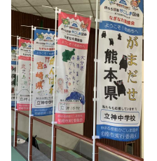
2月に作成した応援のほり旗⇒