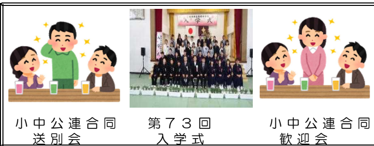
小中公連合同 送別会