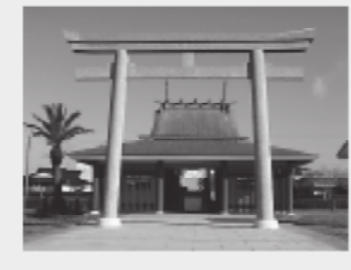
えべ 戒っさん (患比須町)

枕崎市観光ボランティアガイドの2グループ『花渡川クラブ』と『わだつみ会』が隠れた枕崎観光の魅力に迫ります。