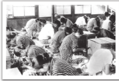
■昔の鯉節工場。小刀で形を整える「削り」の作業風景

市文化財保護審議委員のちゃんサネさんが、枕崎の昔をかたる場所や物を訪ねて、ようよう一句ひねります。