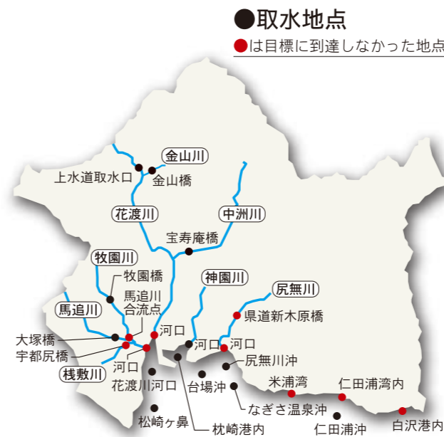
●平成29年度 市内河川の水質検査結果 (平成29年5月、8月、11月、平成30年2月実施分の平均値)