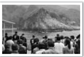
くろしまながれ 黒島流れ =第十六回=

市文化財保護審議会のちゃんサネさんが、枕崎の昔をたづねる場所や物を訪ねて、ようよう一句句にわたります。