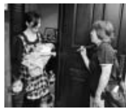
▲訪問の際は身分証明書を提示します

アドバイスなど約30分の訪問は、楽しい会話をしながら進んでいきます。 専門家による訪問なので、より具体的なアドバイスが可能で、スタッフが訪問の際はぜひ、いろんなことを相談してみてください。 ◎問合せ 健康センター TEL 727176