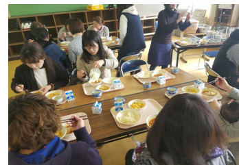
【好評だった試食会】

家庭教育学級活動の一環として、給食試食会を実施しました。当日のメニューは「ソフト麺」でした。参加された26名の保護者の方からは「懐かしいね。」「おいしいね。」という声が多く聞かれました。来年度も実施を考えておりますので、今回参加できなかった方は、来年ぜひ御参加ください。