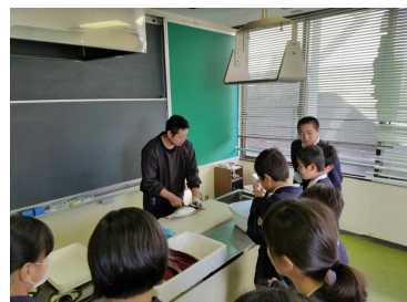
【カツオのさばき方の学習】