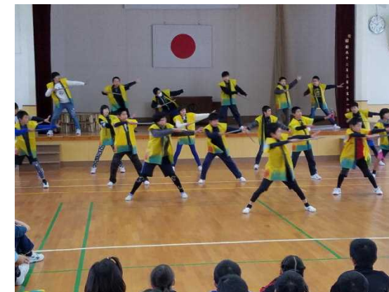
【下級生に贈る6年生の勝男武士の舞】