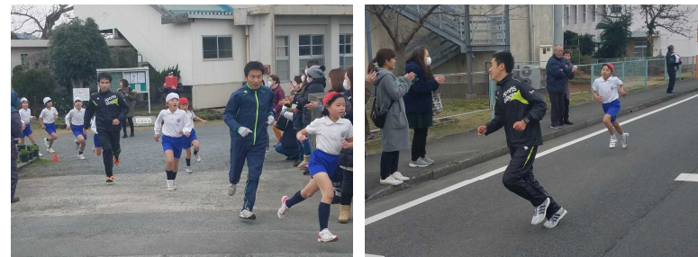
【県下一周駅伝選手の伴走で力走する子どもたち】

伴走の方々のおかげで、自己ベストを更新する子が続出しました。また、1年男子と3年男子では新記録も生まれ、すばらしい大会となりました。県下一周駅伝選手及び関係者の皆様、応援して下さった保護者の皆様、地域の皆様、本当にありがとうございました。