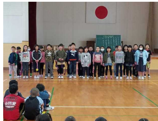
【6年生に感謝の気持ちを込めて】

1校時に「6年生を送る会」を行いました。この1年間、学校のリーダーとして下級生を引っ張ってくれた6年生に、感謝の気持ちを込めて歌や踊り、手作りのペンダントを贈りました。また、6年生も、お返しに勝男武士の踊りを披露しました。