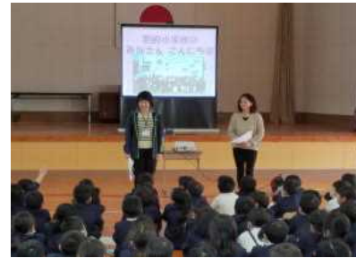
【説明をされる栄養士の先生と調理員さん】

子どもたちが食べる給食は生産者の方、それを運搬する方、メニューを考える方、実際に調理をする方など、多くの方が関わっていることを学びました。