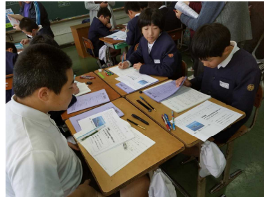
【グループでの意見交換】