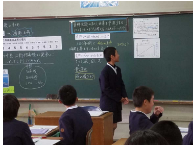
【全体の場での発表】