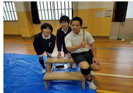
【プランター台が完成しご満悦な3人】

2・3校時に「未来につなぐ森林環境推進事業」の一環として4～6年生の木工教室を実施しました。講師は、南薩地域振興局と市役所農政課の方々です。4年生は、本立てを、5・6年生はプランター台を作りました。約100分ほどで、ほぼ全員が本立てやプランター台を完成させました。