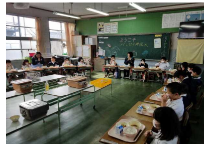
【1年教室での給食の様子】

この日の給食は、お二人と一緒にいただきました。「全部残さず食べてね。」という栄養士の先生の問いかけに、子どもたちは、「はい!」と元気よく返事をしていました。実際、残す子どもはほとんどいませんでした。