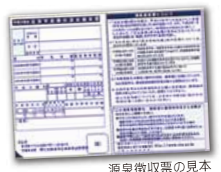
源泉徴収票の見本

国民年金 市民生活課国民年金係 TEL 72-1111 内線145 ねんきん定期専用ダイヤル(特別便) TEL 03-6770-0585 ねんきんダイヤル(一般的な相談) TEL 057-005-1165 I.P.電話・PHSからはTEL03-6770-0116