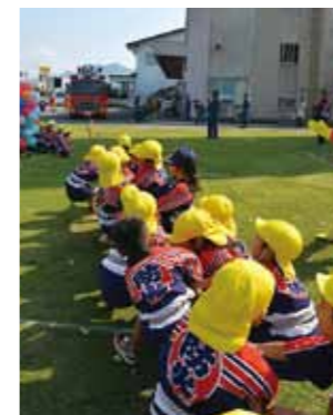
▲消防車と綱引きをする隊員たち

また、11月9日には幼年消防隊員の相互親睦と隊員の育成、活動の強化などを目的とした消防フェスタが同署で行われ、ふじ幼年消防隊と立神幼年消防隊が参加しました。隊員たちは〇×クイズや消防車との綱引きなどさまざまな競技を楽しみ、最後は全員で防火に対する誓いをしました。