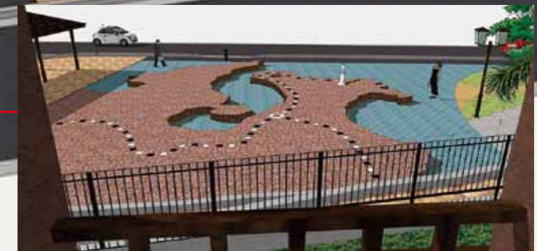
▲上から見たトリックアート

市では、市民や本市出身者など多くの方々の想いが詰まった駅舎の完成に合わせて、県の「魅力ある観光地づくり事業」により、駅周辺整備を進めています。