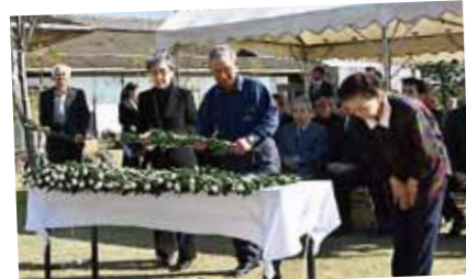
戦没者追悼慰霊祭

■11月18日、枕崎商工会議所青年部の主催で行われました。市内幼稚園・保育園の園児たち手作りの紙灯籠がずらりと並び、枕崎駅舎前広場を幻想的に彩っていました。