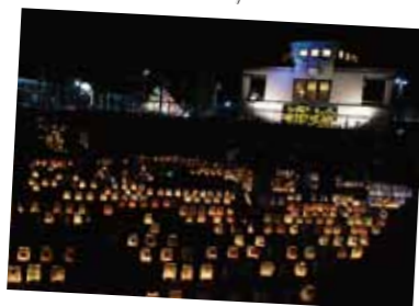
キャンドルフェスタ

■11月12日、森産婦人科病院で開催され、多くの親子が会場を訪れました。育児相談やマッサージコーナー、鯉節削り体験などさまざまなブースが設けられたほか、抽選会も行われ、大人も子どもも一緒に楽しんでいました。