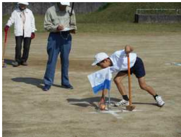
【グラウンドゴルフの様子】