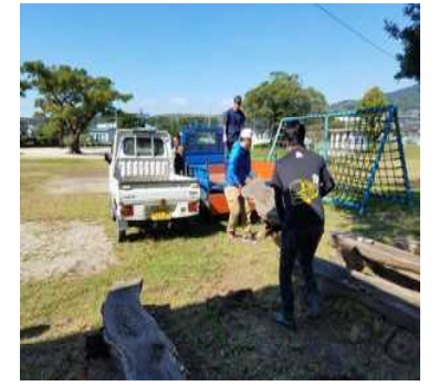
【ベンチ撤去の様子】

当日は、おやじの会から4名来られて、約2時間かけてベンチの撤去と草の除去をしてくださいました。おやじの会の皆様、ありがとうございました。今後ともよろしくお願ひします。