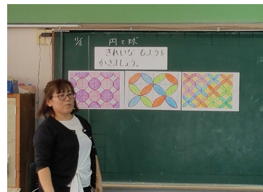
【提示された円を使った模様】

5時間目に3年生算数「円と球」の研究授業を行いました。担任の先生の出された円を使った模様を見た子どもたちは、俄然やる気を出し、3つ示された模様の中から1つを選び模様作りを始めました。