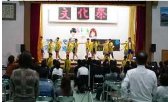
【大きな拍手をいただいた6年生の舞】

4年生が、校区老人クラブの方々とグラウンドゴルフをしている頃、6年生は別府中学校の文化祭で「勝男武士」と「ソーラン節」の舞を披露し、会場から割れんばかりの拍手をいただきました。