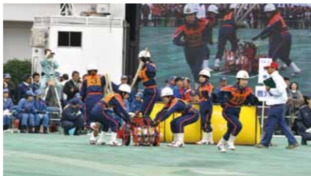
▲枕崎市女性消防隊が出場した全国女性消防操法大会(平成23年・横浜市)

問合せ 総務課危機管理対策係 TEL 7 2-1 1 1 1 (内線 2 1 4)