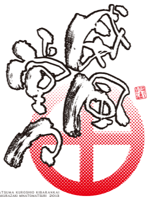
▲今年のTシャツのデザイン

私が初めてデザインしたのは「群(なぐら)」。それから「宝来栄弥」、「枕流」、「天空海闊」、「粋」、「二丸」、「動」、「滴の汗」、「結」と続き、そして今年には「威風堂々」。これらの文字は、私が筆による一