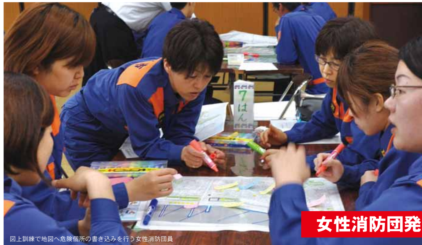
図上訓練で地図へ危険個所の書き込みを行う女性消防団員

連絡体制の一助を担うこととなります。これまでなかった女性消防団員ならではの「視点」を取り入れ、男女それぞれの意見を出し合い、集約することで、更なる防災・減災対策の充実が図られることが期待されます。 各地域においても、これから実施される様々な訓練に進んで参加し、その経験をもとに多くの意見を出し合い、「災害に強い枕崎市」の実現に向けて、一体となつて取り組みましょう。 問合せ 枕崎市消防本部消防総務課消防団係 TEL 7 2 0 0 4 9