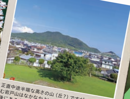
片平山 [かたひらやま] からの眺め

正直中途半端な高さの山(丘?)ですが、ここから望む岩戸山はなかなかよいです。もちろん、枕崎駅の背後にある山なので市街地も望めますが、おすすめは岩戸山方面。山の存在感と裾野に広がる家並みの融合の妙がすばらしいです。