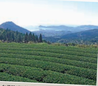
大国寺前 [だいくくじまえ] からの眺め

こんな場所が枕崎に、と思えるくらいにあまり見たことのないような風景が広がっています。それはけっごうな斜面に広がる茶畑。まるでマチュピチュ(いいすぎ?)。遠くに枕崎市街地と岩戸山も見えて枕崎と確認。