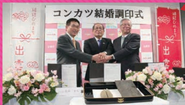
平成26年2月19日、稚内・枕崎両市長が「縁結びのまち」である出雲市を訪れ、出雲大社にて「枕崎鯉節」と「稚内利尻昆布」を奉納、出雲市役所にて出雲市長立ち合いのもと「枕崎鯉節・稚内利尻昆布コンカツ結婚書」に署名しました。

地域の特産を活かした御当地ラーメンが乱立しはじめた2000年代初頭、鯉節のまち枕崎がだまっているはずがありませんでした。本枯れ節をぜいたくに使用し、そのスープに合う具材に工夫を凝らし誕生したのがかつおラーメン。料飲業組合枕崎支部の有志により開発された至高のラーメンは現在市内3店舗で食べることができます。