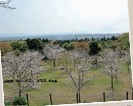
瀬戸公園 [せとこうえん] からの眺め

昔は競馬場がありました。桜の季節には多くの方が訪れます。そして瀬戸公園は東シナ海の東側から上がる朝日を美しく望めるスポット。薄赤色に徐々に空や雲が染まり始める様子は感動的。