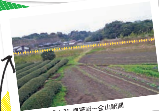
盛土跡-鹿籠駅～金山駅間