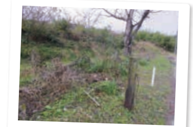
かつての金山駅跡

当時の面影を追うのは困難。でも鹿児島を代表する金山があったことを象徴してくれる名前がしっかり刻まれています。駅が開業した昭和6年は、まだ金山も営まれていました。この駅を過ぎると次は久木野駅（現在の南さつま市）になります。