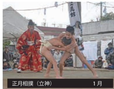
正月相撲 (立神) 1月