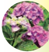
あじさい (瀬戸公園)