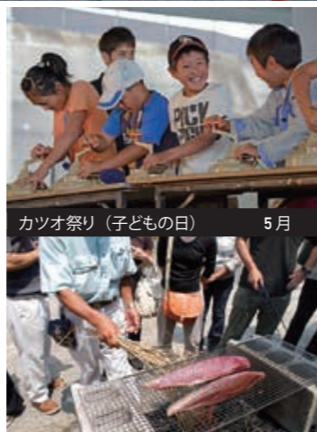
カツオ祭り (子どもの日) 5月