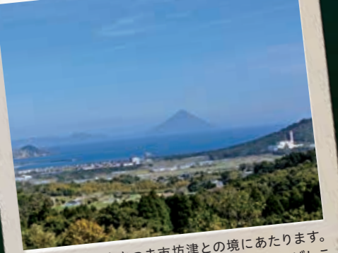
耳取峠 [みみとりとうげ] からの眺め

枕崎市とお隣南さつま市坊津との境にあたります。けっごうブッソウな名前の峠ですが、旅人がしばしの景色に見とれた→みみとり、で耳取峠と名がついたとも言われています。