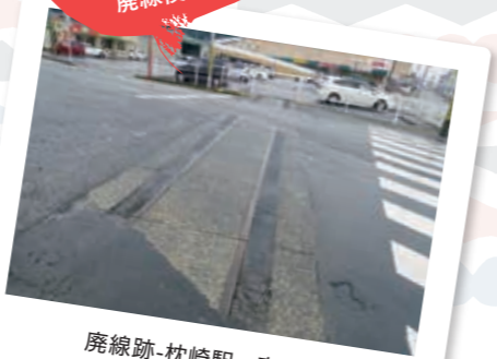
廢線跡-枕崎駅～鹿籠駅間