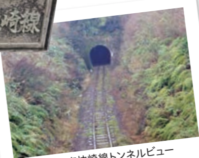
指宿枕崎線トンネルビュー（遠見跨線橋より）