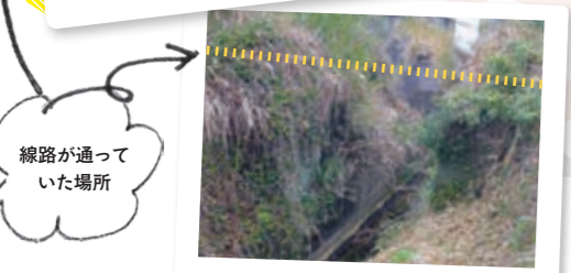
橋脚跡-鹿籠駅～金山駅間