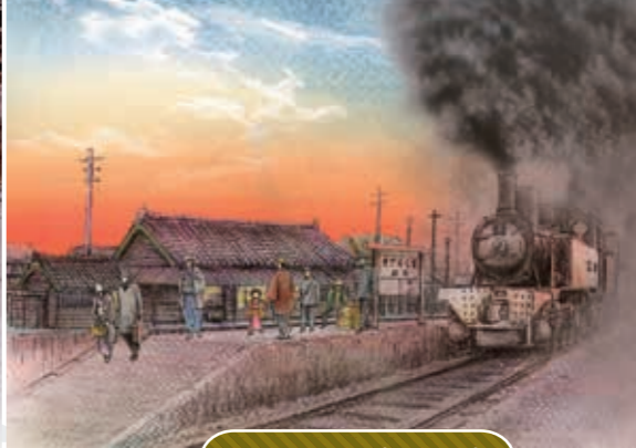
初代枕崎駅舎（スケッチ）