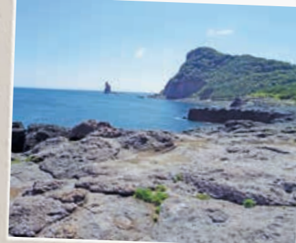
火之神公園 [ひのかみこうえん] からの眺め

目の前には枕崎のシンボルのひとつ高さ42mの立神岩。海から突き出るようにそびえる立神岩はなんといっても絵になります。その向こうに広がる東シナ海。そして開聞岳も遠くに見えます。まさしく絶景ですよ。