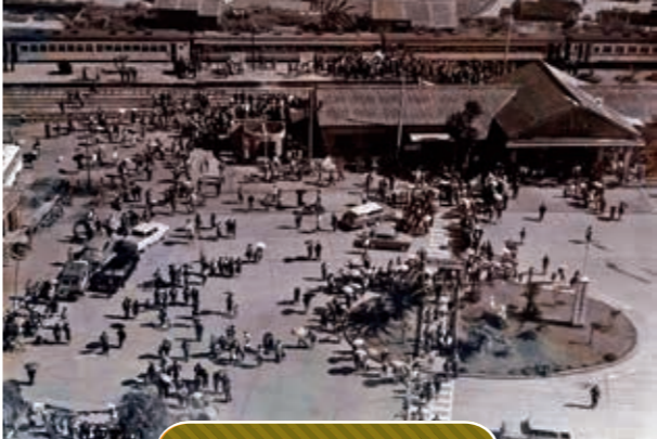
昭和38年指宿枕崎線開通時

現在は駐輪所に姿を変えてしまいましたが、周辺の道路の広がりなどからかつて駅があったことを理解させてくれます。この駅から運搬されたのが地元産の黒豚である「鹿籠豚」。まさに駅名がそのままに地域のブランド黒豚になったようなかたちです。それだけ、この駅が繁栄した時代があったといえます。