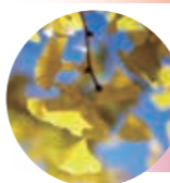
いちよう (金山小跡)