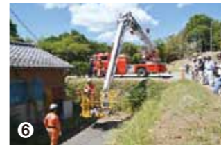
①避難訓練 ②炊き出し訓練 ③応急処置訓練 ④救急手当・搬送訓練 ⑤水防訓練 ⑥屈折はしご付消防自動車の実働訓練

都公民館の住民が一斉避難の訓練を行いました。 その後、桜山小学校では、自主防災組織や女性消防団等による応急処置訓練や救急手当・搬送訓練、消防団による水防訓練、まくらぎきハーモニネットワーク委員会と地域の女性たちによる炊き出し訓練などが行われました。 また、3月に導入された屈折はしご付消防自動車の実働訓練もあり、参加者は興味深