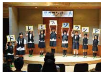
8月11日、枕崎少年少女合唱団