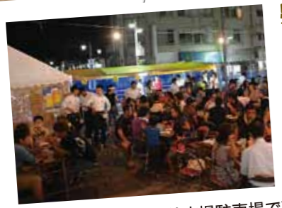
駅前広場にビアガーデン

■9月21日、市民会館で行われました。枕崎中学校吹奏楽部の出演や枕崎高校吹奏楽部との合同演奏があり、アンコールでは「枕崎音頭」が演奏されました。