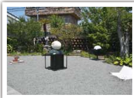
▲薩摩酒造「明治蔵」会場