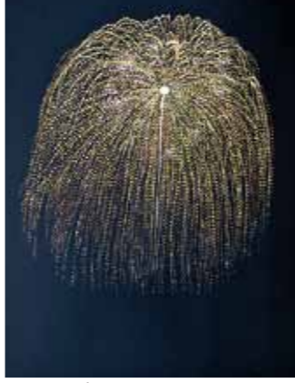
▲スタッフホストという釘の頭で着色していく技法で制作された「三尺玉」

私のスタジオ開室10年を記念して、2001年に南浜館で個展を開催しました。翌年から鹿児島MBC学園と枕崎で教室がス