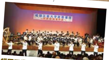
福岡工業大学吹奏楽団 特別演奏会

■9月13日、鹿児島水産高校の実習船「薩摩青雲丸」がハワイ沖での実習航海に向け、枕崎漁港を出発しました。今回参加する20名の生徒たちは多くの人たちに見送られ、航海へ向かいました。