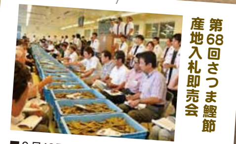
第68回さつま鯉節 産地入札即売会

■9月12日、枕崎水産加工業協同組合の入札会場で開催され、市内23社が出品。全国から集まった仲買人らが、コンペアーで運ばれてくるかつお節とさば節に次々と値をつけていきました。