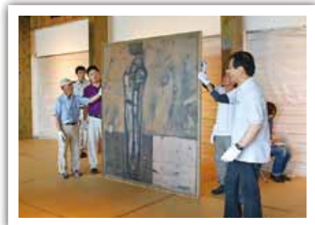
▲搬入作業もボランティアの協力でスムーズに