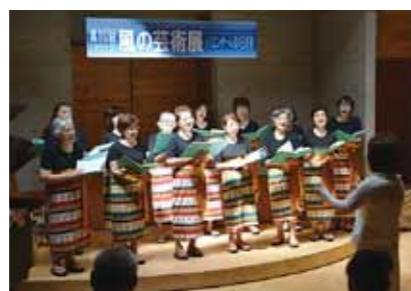
8月25日、枕崎マリンコーラス