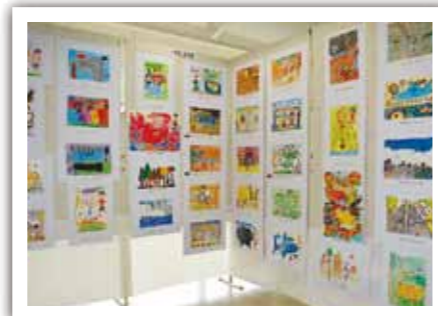
▲同時開催された、風まくらざきジュニア展