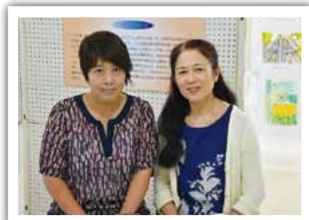
▲会期中、延べ211人のボランティアが運営をサポート