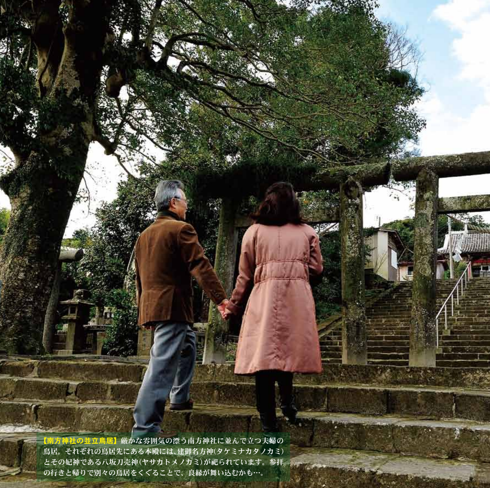
【南方神社の並立鳥居】 厳かな雰囲気漂う南方神社に並んで立つ夫婦の鳥居。それぞれの鳥居先にある本殿には、建御名方神(タケミナカタノカミ)とその妃神である八坂刀売神(ヤサカトメノカミ)が祀られています。参拝の行きと帰りで別々の鳥居をくぐることで、良縁が舞い込むかも…。

平成26年2月19日に縁結びのまちとして名高い島根県出雲市で結婚した枕崎の「鯉節」と稚内の「昆布」コンブとカツオでコンカツ(昆鯉)コンカツプロジェクトの始まりです 先月、結婚2周年を迎えた昆布と鯉節 出汁の効いた交流はますます盛んになっています 今回、人と人、町と町を結び地域の活性化を目指す コンカツプロジェクトの取り組みや プロジェクトに携わる人たち取材しました