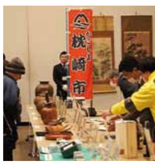
▲合同公売会の様子

1月28日に県民交流センターで、県と枕崎市ほか12市町による合同公売会が開催されました。公売会には市税等の滞納により差し押えられた財産を売却して、その買受代金を滞納している税に充てることにより、滞納額の縮減を図るものです。公売会には美術品や日用品など、335点の公売物件が出品。そのうち284点が売却され、滞納市税等に充てられました。