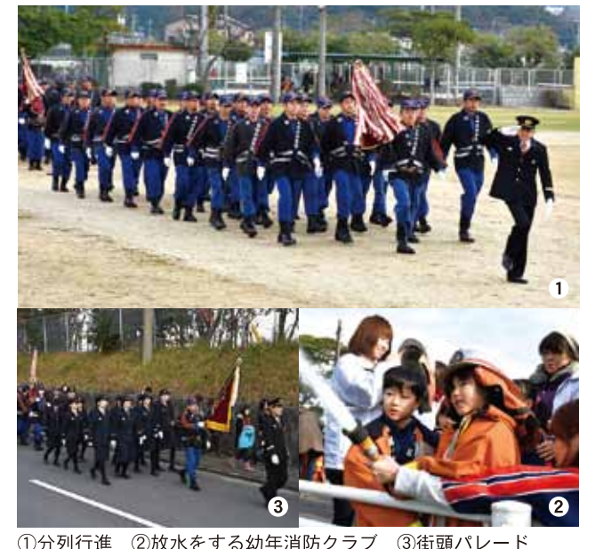
①分列行進 ②放水をする幼年消防クラブ ③街頭パレード

消防出初式が1月10日、塩浜運動場で行われ、消防署員や消防団員、幼年消防クラブなど約350人が参加しました。火の神乙女太鼓隊によるオープニング演奏に始まり、分列行進や消防車・小型ポンプによる花渡川への一斉放水など日頃の訓練の成果を披露しました。このあと、幼年消防クラブを先頭に街頭パレードが行われ、沿道に集まった市民から大きな拍手が送られていました。