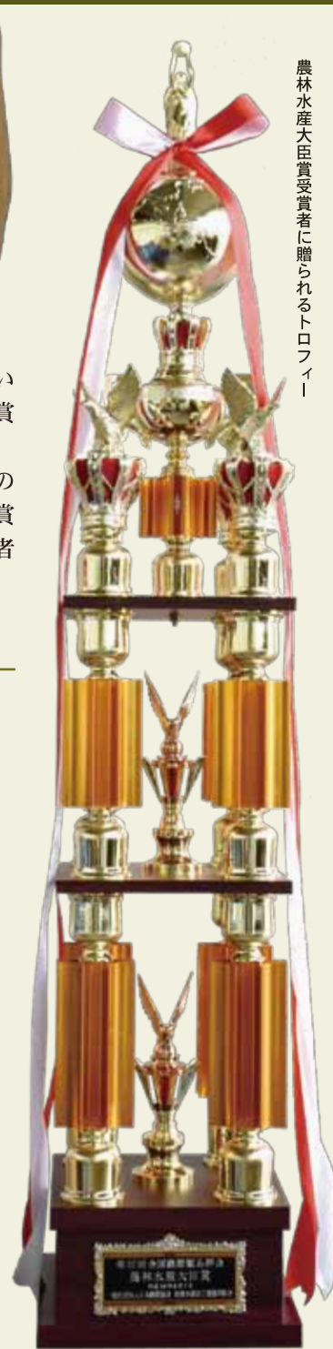
農林水産大臣賞受賞者に贈られるトロフィー

◎出品材：丸サバ節 今回の賞は、従業員、家族、友人の皆さんのおかげでいただくことができ、大変感謝いたしております。そして、業界がますます発展していくように、微力ながらゆっくり歩いていきたいと思っております。