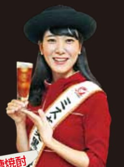
2015ミス奄美黒糖焼酎

「黒「糖」焼酎だから糖質が多い」とよく誤解されますが、本格焼酎は全て糖質ゼロ。ダイエットにも最適です。黒糖焼酎は奄美地方でしか造られない特別なお酒。すっきりした味わいで、どんな割り方も合います。私は紅茶割りがよく楽しんでますよ。