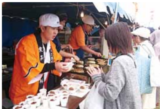
鹿児島水産高校のブースで奮闘する生徒たち

また、枕崎市通り会連合会は、昨年に続き「昆鯉 枕崎鯉大トロ井」を販売。こちらも用意した500食を完売する相変わらぬ人気ぶりでした。