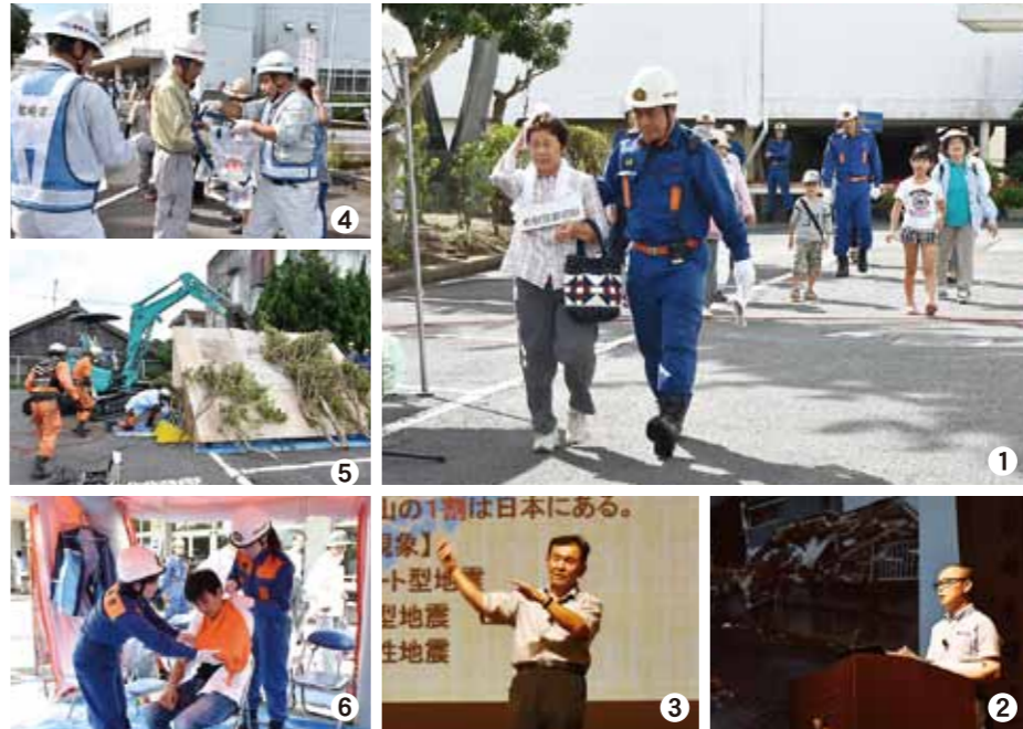
①避難誘導訓練 ②熊本地震派遣職員の活動報告 ③防災講演会 ④災害応急給水活動訓練 ⑤災害応急救助活動訓練 ⑥応急救置訓練

ら約350人の参加がありました。始めに市民会館を避難所として、防災無線から流れる大津波警報の放送に従い、枕崎