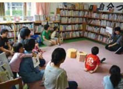
▲昨年の自分づくり講座の様子