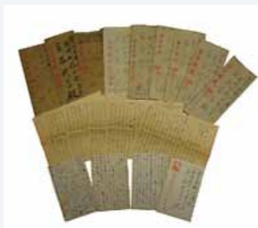
▲硫黄島から送られた手紙

最初は、隊にはどんな仲間がいて、こういう出来事があったとかが書いてありました。私が生まれたのが11月だったんですが、12月に届いた手紙には『男子出生の知らせあり』と書いた紙が演習から帰ったら机の上に置いてあって『知らせを聞き、非常に誇りに思う』ということが書いてあります。その他にも生まれた喜びが書いてあって、まさに『親バカ』丸出しですよ。その後の手紙には、