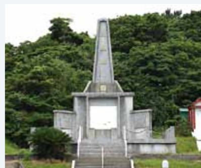
▲片平山に立つ慰霊塔

枕崎神社の横に、昭和38年に遺族会が建てた慰霊塔があるんです。以前は遺族会で大きな慰霊祭をしてたようですが、最近では行われていません。遺族が高齢になってできなくなつたんでしょ。遺族会の運営もやはり難しくなっているように思います。でも、遺族会の目的を続けていくためには後世まで伝え続けていかなければならない。孫・ひ孫の代まで、日本遺族会でも動きはあるようだし、県内でも実際に、孫・ひ孫の会が発足しています。私は枕崎でも孫・ひ孫の会を結成して、慰霊祭