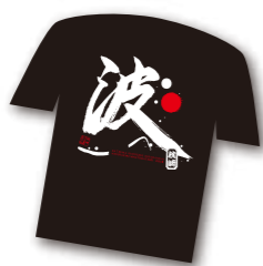
色は黒 サイズは選べます