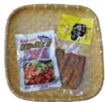
枕崎かつおユッケ&かつお腹身スティック(レモン風味)セット(3名様) 【提供】南薩地域地場産業振興センター

★応募方法 ハガキもしくはメールにて、氏名・ペンネーム・住所・電話番号・年齢・性別・クイズの答え・本紙への「意見や」要望、枕崎への想いや身近にあった出来事などを記入の上、応募ください。いただいたお便りは、「ご紹介させていただく場合があります。文章は添削させていただく場合があります。なお、プレゼントの抽選は、「意見や出来事への記入がある方を優先させていただきます。」と承ください。