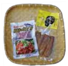
枕崎かつおユッケ&かつお腹身スティック(レモン風味)セット(3名様)

ホエールズさんお便りあいごともさげます。「ほんのこてわかしはちこわんごなつとつどな。なごならんごなつだつていがんすまんちおいもおもど本当に若い人は使わなくなってますよね。無くならないように語っていかないとけないと私も思います。」