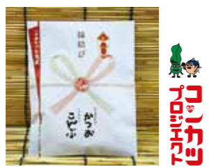
縁結び一本釣りがつお角煮(5名様)【提供】枕崎市漁業協同組合

★応募方法 ハガキもしくはメールにて、氏名・ペンネーム・住所・電話番号・年齢・性別・クイズの答え・本紙へのご意見やご要望 枕崎への想いや身近にあった出来事などを記入の上応募ください。いただいたお便りは、ご紹介させていただく場合があります。文章は添削させていただく場合があります。なお、プレゼントの抽選は、ご意見や出来事への記入がある方を優先させていただきます。ご了承ください。