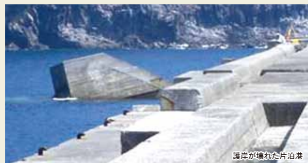
護岸が壊れた片泊港