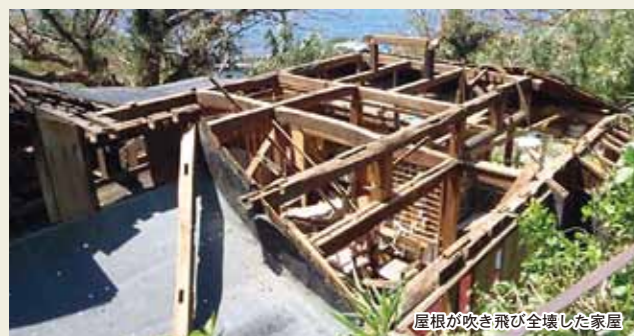
屋根が吹き飛び全壊した家屋