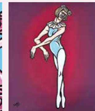
BALLET GIRL ルルベ