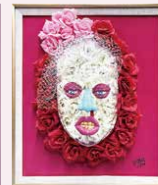
OTOME Aristocratic a prostitute Derudora