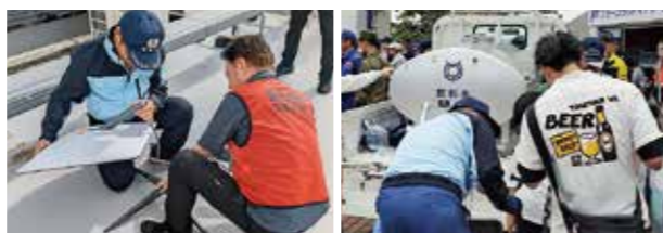
▲スターリンクの設置運営訓練 ▲給水支援訓練

5月24日、南さつま市において行われた、令和8年度鹿児島県総合防災訓練に本市から、総務課危機管理対策係、水道課、消防本部、枕崎市消防団が参加しました。今回の訓練は、線状降水帯による大雨の中、最大震度6弱の地震が発生し、南さつま市を中心に、土砂崩れや冠水による浸水被害などの甚大な被害をもたらす複合災害を想定して行われました。