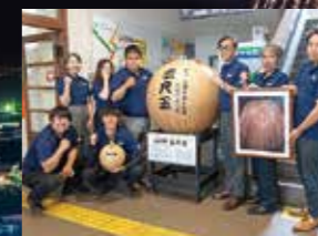
5月28日、市役所に三尺玉のレプリカが設置されました。三尺玉花火を市民一丸となり打ち上げよう！

■問合せ きばらん海まつり事務局 TEL78-3020 (平日午前10時～午後4時) 水産商工課観光交流係 TEL76-1668