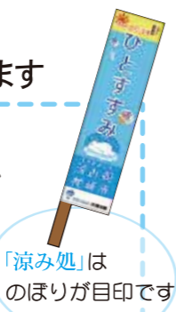
「涼み処」はのぼりが目印です