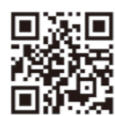
南浜館 ホームページ