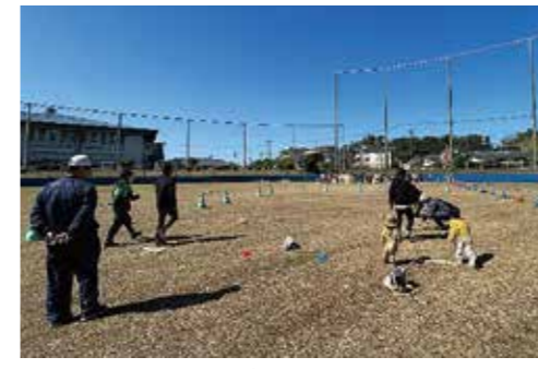
▲春の市モルックブースの様子