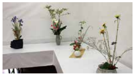
▲昨年の「薫風の陶芸展」