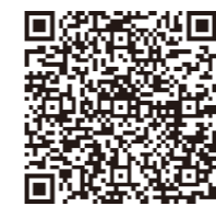
▲血圧計の設置場所(市ホームページ)

は、市ホームページをご覧ください。普段立ち寄るところに血圧計を見かけたら、ぜひ測定してみてください。