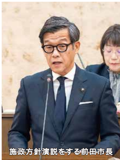
施政方針演説をする前田市長