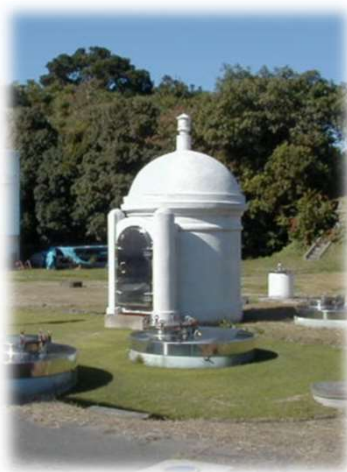
深浦ポンプ場 シンボルの円筒の建物

水質汚染事故が発生した場合、枕崎市役所市民生活課、加世田保健所、鹿児島県保健福祉部生活衛生課、水道関係事業者等と情報交換するとともに、連携して現地調査、水質検査等を行い、対策を講じます。