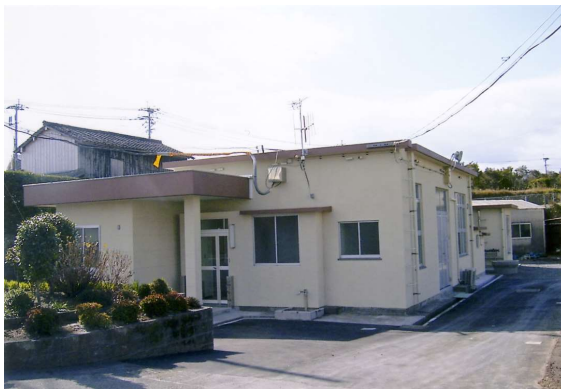
深浦ポンプ場管理棟