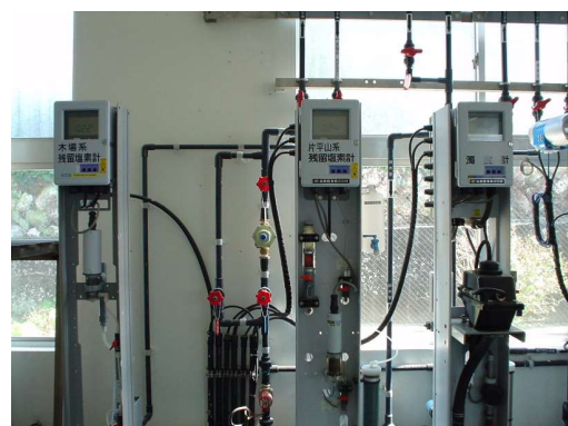
深浦ポンプ場 水質検査計器