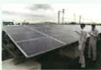
太陽発電設備の検査の様子

使用済みとなった太陽光 パネルには、再販売可能な ものもあり、既に多くのリ ユース事例が報告されて います。