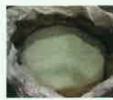
破碎・選別したガラス