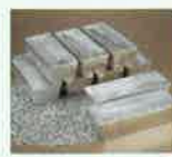
有用金属(銀)のイメージ