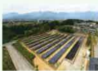
リユース品を使用した発電所