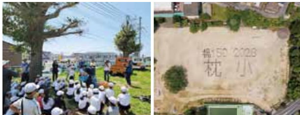
▲カウントダウン焼耐用の芋掘り ▲撮影した航空写真