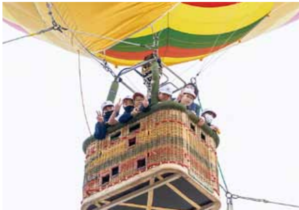
▲上空から地上を望む児童たち