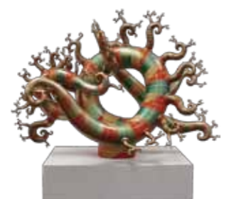
▲新収蔵品 河口洋一郎氏作「グロース」