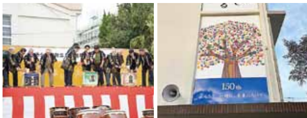
▲祝賀縁日祭での鏡開き ▲在校児童による記念壁画

12月9日、枕崎小学校150周年事業として熱気球体験搭乗が実施されました。搭乗した在校生や保護者、地域の住民は、地上で待つ人たちに手を振ったり、写真を撮ったりしながら小学校上空の景色を楽しみました。