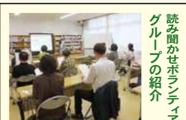
読み聞かせボランティアグループの紹介

読み聞かせボランティアグループ連絡会は、市内7つの読み聞かせボランティアグループで構成され、スキルアップを目指して、情報交換や研修を行っています。