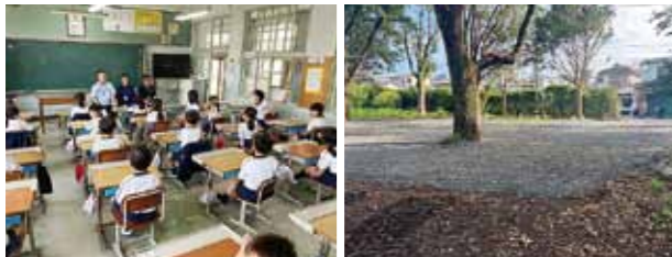
▲時を超えての交流会 ▲100周年記念の森整備