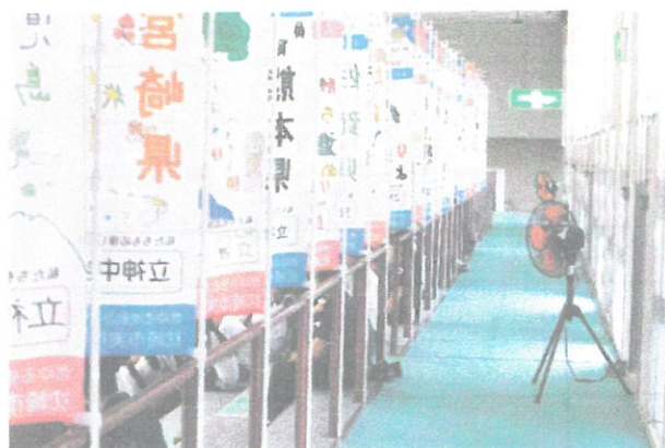
都道府県応援のぼり旗（2階通路）