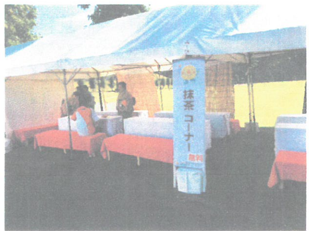
ふるまい（抹茶と和菓子）