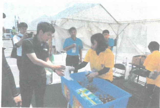
屋外ドリンクコーナー