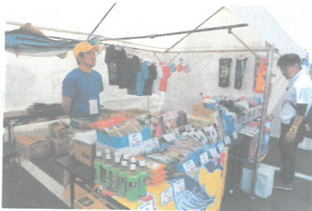
南薩地域地場産業振興センター