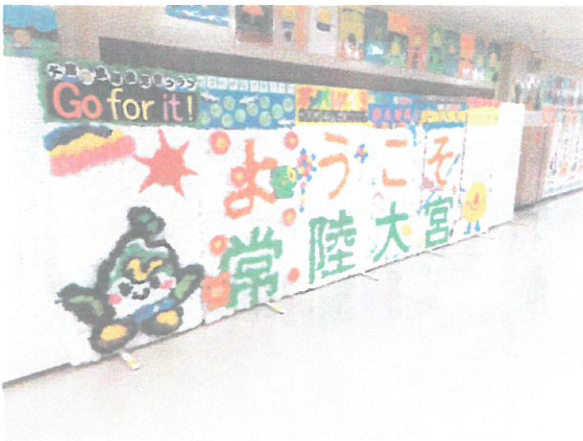
歓迎装飾（競技会場内）