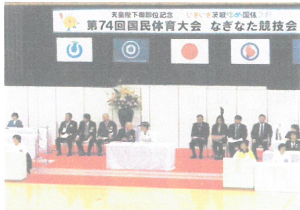
高円宮妃殿下 お成り