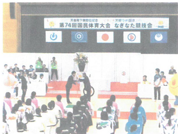
なぎなたのリレー（常陸大宮市から枕崎市へ）