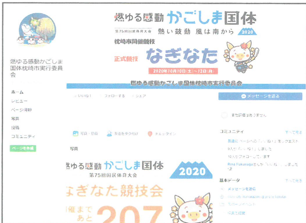
フェイスブック公式ページ