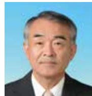
森 史明 議員 動画視聴