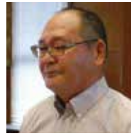
議員 幸 正 迫 上