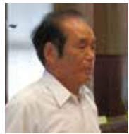
堀 占通 議員