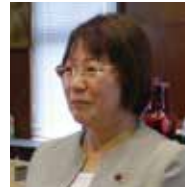
議員 美 弘 茅 眞