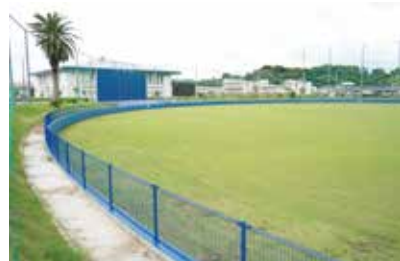
多目的に利用できるよう改修された市営野球場

14億5799万8000円の増となっています。財政健全化法に定められている実質公債費比率は8.4%で、3か年平均では12年連続で改善し、前年度に比べ0.9ポイント低くなっています。将来負担比率は該当なしとなっています。