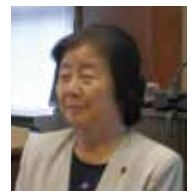
豊留 榮子 議員