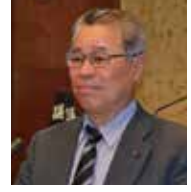
中原 重信 議員