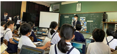
研究授業(道徳)の様子

ました。参加者から沢山の褒めめ言葉をいただきました。研究主題は「よりよい環境づくりに主体的