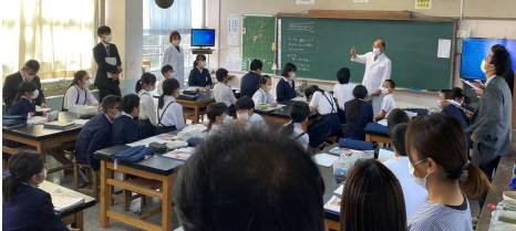
研究授業(理科)の様子

「いか」という目指す児童像を明確にしました。低学年では、まずは自然体験を豊かにしながら自然に関する様々な気づきを、中学年では少しずつ環境について自分事として考えることを大切にします。そして、高学年では環境問題を主体的に考え行動することができるよう小学校6年間をかけて育てていくイメージをもちました。