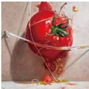
「記憶 - tomato」[平面作品] 【オーディエンス賞(準大賞)】

オーディエンス賞大賞に選ばれたのは、永井寿郎さん（東京都・鹿児島市出身）の作品「SkyCollection@2022」で、投票総数890票のうち82票を獲得しました。