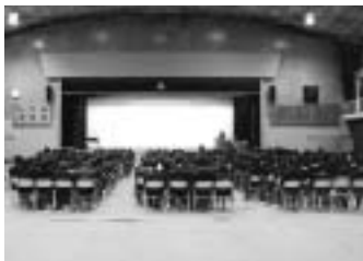
◀「総合学科学習活動発表会」の様子

一年次の「産業社会と人間」 二年次の「創意」三年次の 「課題研究」の一年間の学習活動の成果を発表します。 1月28日に行われました。