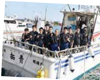
かつお釣り体験アドベンチャー

■7月16日、まくらぎきハーモニーネットワーク委員会の主催で、戦争の悲しみを描いた映画「ひまわり」のチャリティ上映会が開催され、売上金の一部と会場での募金を人道支援金として在日ウクライナ大使館へ寄附しました。会場では、西白沢子供会が育てたひまわりが来場者に配布されました。