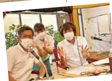
今年もOSOTOでラジオでもきばらん海

■7月26日、口永良部島近海で行われ、市内の中学生10名が鹿児島水産高校の実習船「拓青」に乗船して、釣り体験を行いました。今回はサワラやカツオなど合計11匹の釣果がありました。