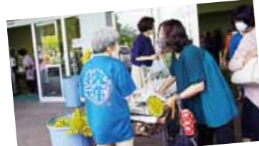
ウクライナ支援チャリティ上映会を開催

■7月16日、まくらぎきハーモニーネットワーク委員会の主催で、戦争の悲しみを描いた映画「ひまわり」のチャリティ上映会が開催され、売上金の一部と会場での募金を人道支援金として在日ウクライナ大使館へ寄附しました。会場では、西白沢子供会が育てたひまわりが来場者に配布されました。