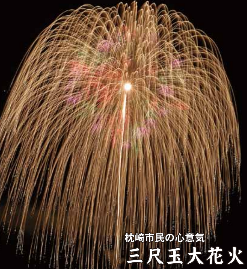
枕崎市民の心意気 三尺玉大花火

6月14日、市役所に三尺玉のレプリカが設置されました。三尺玉大花火を市民一丸となって打ち上げよう！