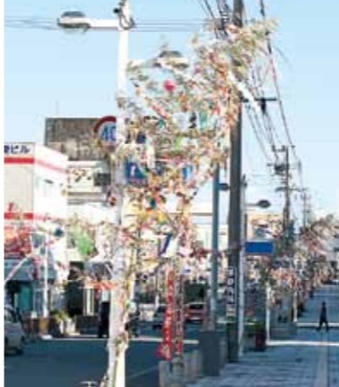
▲昨年、駅通り商店街に設置された七夕飾り

私 は自分の人生を女優のように演じながら楽しんでいくのかもしれない。決して裕福ではない商売人の子として育ったが始まりなのかも。奈良県出身の私は、大阪で働く主人と縁あって結婚。29歳の時に主人の故郷の枕崎に移り住んだ。ネオン街でガヤガヤ生きていた私は、毎日、淋しく、よそもの「コンプレックスだったのか、なかなか人にもなじめず、関西に帰りたい」と、ずっと悶々とした日々を送っていた。夫婦喧嘩をずっと「いつでもこの町を出ていくから」と、今では考えられない言葉を発していた頃があった。あれから23年の月日が過ぎた。