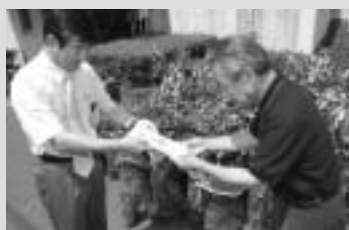
九州電力加世田営業所が小・中学校に苗木を寄贈

■九州電力加世田営業所が小・中学校に苗木を寄贈。同営業所からは、昨年と同様に小・中学校に苗木をいただいています。