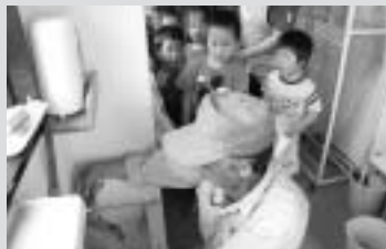
水道工事協会加盟12社が水道設備点検などを実施

■6月1日から7日まで『全国水道週間』が実施されました。この一環として、期間中の6月5日、市内水道工業業協会加盟12社がボランティアで市内の5保育園、1幼稚園、2か所の公園で、水道設備の点検、簡易な水道資材の取替えや水漏れの調査などを行いました。