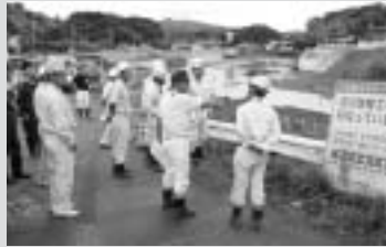
建設業協会（10業者加盟）が防災点検を実施

■6月13日、県建設業協会加世田支部の本市加入業者がボランティア活動の一環として、花渡川や馬追川、岩戸海岸や土石流危険渓流などの防災点検を行いました。また、土砂災害などへの備えとして大型土のう100袋分の土砂置場を美初地区と木場地区に準備していただいています。